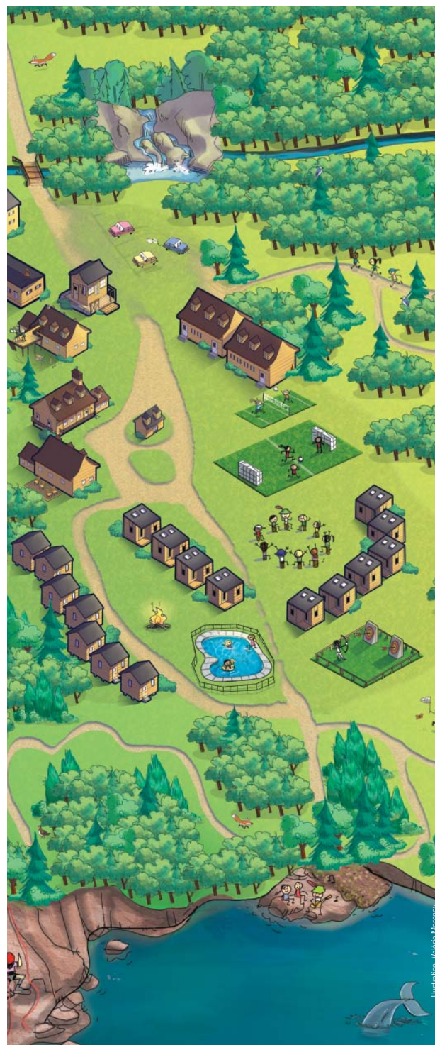
Illustration: Valérie Morancy